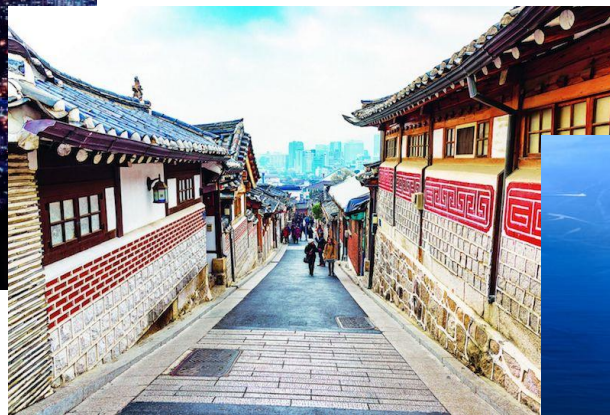
Seoul less than 2 hours by KTX train (about 35€)