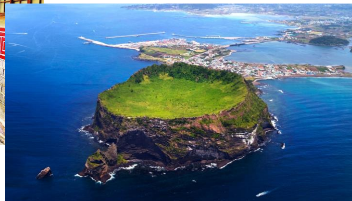
Jeju Island less than 1 hour by plane (about 60€)